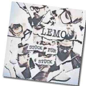
Videos auf www.zett.it

SÜDTIROL Austropop. Welch ein Begriff! Sofort fallen einem Reinhard Fendrich, STS oder Wolfgang Ambros ein. In den vergangenen Jahren hat sich aber längst eine neue Generation von österreichischen Musikern den Begriff Austropop geschnappt und ihn modern verpackt. Dazu zählen Musiker wie Julian LePlay, Seiler & Speer, Tagträumer, Flow-