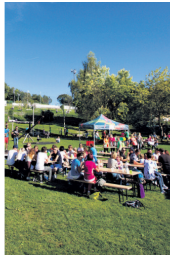
Viel Spaß und Unterhaltung verspricht das sommer.picknick in Terenten

Am neu gestalteten Spielplatz von Terenten warten am 5. August von 10 bis 13 Uhr Spiel-, Bastel- und Sportstationen auf die ganze Familie. Angefangen beim Stockbrotbacken, Sommercocktails selber mixen bis hin zu erfrischenden Wasserspielen und vielem mehr. Für sommerliche Stimmung sorgt die Livemusik der Band „2ManGroup“. Einfach die Seele baumeln lassen, es sich auf der eigenen Picknickdecke gemütlich machen und in verschiedene Abenteuer eintauchen. Das sommer.picknick wird vom Jugenddienst Dekanat Bruneck unter anderem in Zusammenarbeit mit der Jugendgruppe Terenten organisiert.