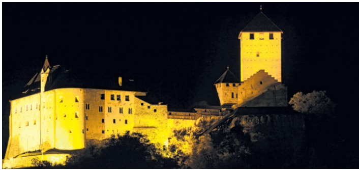
Auf Schloss Tirol wird das Stück „Die Verfolgten“ von Luis Zagler aufgeführt.