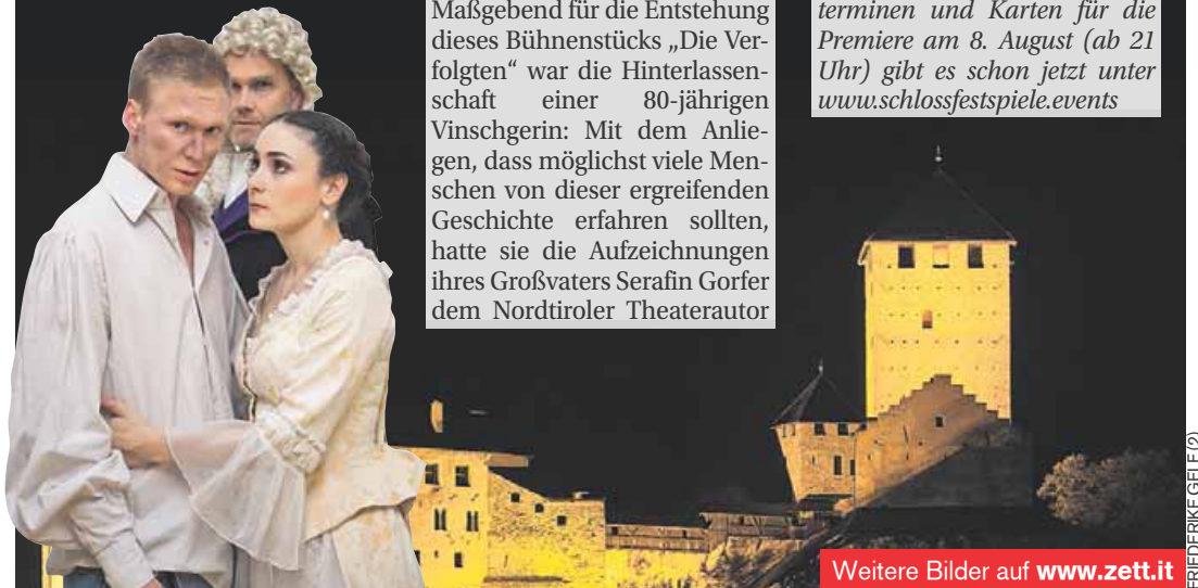
Weitere Bilder auf www.zett.it

► Info zu den weiteren Spielterminen und Karten für die Premiere am 8. August (ab 21 Uhr) gibt es schon jetzt unter www.schlossfestspiele.events