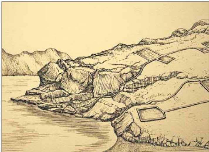
Chiusole zeigt Reflexionen von Erlebnissen auf einer Insel in Kroatien.